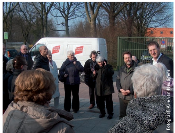
De Energiebus op bezoek bij complex Tuinenhoven in Rotterdam IJsselmonde.