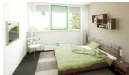
Een aangenaam binnenklimaat ontstaat door een speciaal ventilatiesysteem dat de luchtvervuiling en de relatieve vochtigheid meet en reguleert.

“De resultaten zijn essentieel voor de ontwikkeling van wonen in de toekomst.”