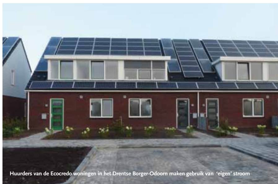
Huurders van de Ecocredo woningen in het Drentse Borger-Odoorn maken gebruik van 'eigen' stroom

Wooncorporatie Lefier ZuidoostDrenthe bouwde twaalf sociale huurwoningen die net zoveel stroom produceren als een gemiddeld gezin gebruikt. Dat is ongeveer 3.500 kWh aan elektriciteit. Daarmee bewijst de corporatie dat energieneutraal wonen ook kan in de sociale woningbouw.