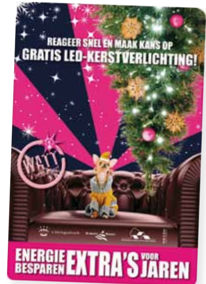
Opvallend promotiemateriaal voor WATT 'n besparing attendeerde huurders op de actie

De corporaties vonden het belangrijk de actie van de gemeente 's-Hertogenbosch te ondersteunen. Baltus: “We bouwen veel duurzaam en nemen bij renovaties allerhande energiebesparende maatregelen mee, zoals isolatie en energiezuinige CV-ketels.