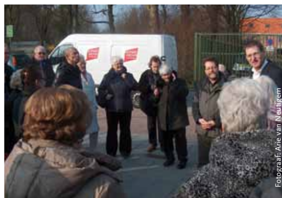
De Energiebus op bezoek bij complex Tuinenhoven in Rotterdam IJsselmonde.